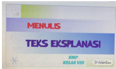
Gambar 1 Aplikasi Powtoon

Aplikasi powtoon dapat digunakan sebagai media pembelajaran. Aplikasi ini dapat kita gunakan untuk mendesain media pembelajaran tersebut semenarik mungkin.