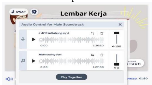
Gambar 2 Aplikasi Powtoon

Kita juga dapat menambahkan suara bahkan dapat mengedit dan menjernihkan suara tersebut.