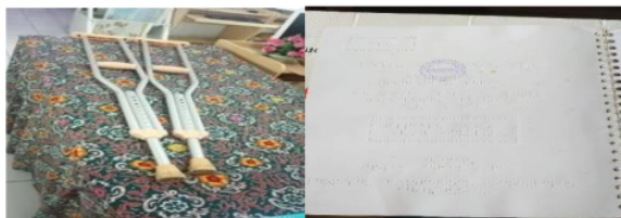
Gambar 8. Penunjang layanan disabilitas.

Layanan Disabilitas adalah perpustakaan menyediakan bahan pustaka koleksi Disabilitas untuk menambah pengetahuan anggota perpustakaan mengenai jenis koleksi khusus.