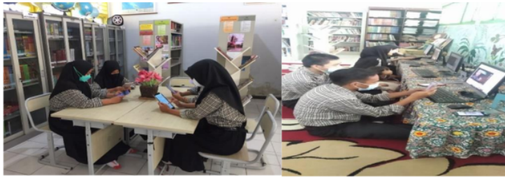
Gambar 6. Penggunaan akses internet

Perpustakaan sebagai ruang public juga memfasilitasi siswa dan pengunjung dengan layanan wi-fi, pengunjung dibebaskan mengakses dan menggunakan fasilitas internet, computer, laptop bahkan tablet yang telah disediakan perpustakaan Cahaya Ilmu SMAN 1 Bengkulu Tengah.