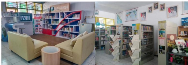
Gambar 5. Koleksi yang tersedia

Kegiatan menyediakan dan memberikan fasilitas pencarian 18 bahan pustaka sesuai dengan kebutuhan pemustaka melalui koleksi-koleksi setempat atau melalui silang layan perpustakaan merupakan salah satu cara perpustakaan untuk memberikan fasilitas dan layanan terbaik bagi setiap kebutuhan pemustaka.