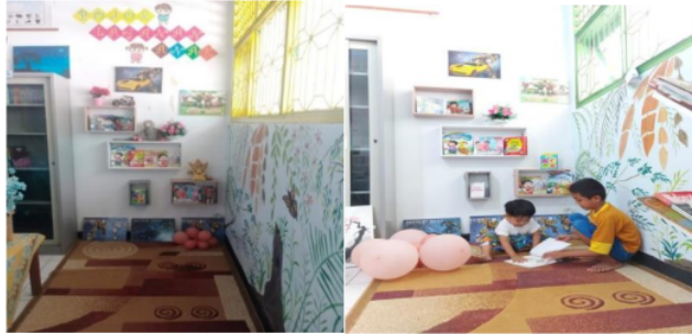
Gambar 4. Layanan Anak

Layanan anak disediakan perpustakaan untuk menambah ilmu pengetahuan dan menumbuhkan minat baca bagi anak-anak, hal ini dilakukan dengan disediakannya koleksi anak. Layanan ini dikhususnya untuk anak-anak guru yang dibawa ke sekolah.