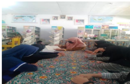
Gambar 3. Pustakawan Bercerita tentang buku Soekarno

Layanan Bercerita Perpustakaan Cahaya Ilmu adalah layanan yang disediakan oleh perpustakaan untuk siswa SMAN 1 Bengkulu Tengah mengenai koleksi buku yang dimiliki, Pustakawan menceritakan isi dari buku-buku yang baru dan menarik bagi pembaca.