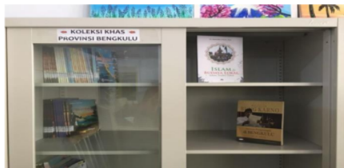
Gambar 7. Koleksi Kedaerahan yang disebut Bengkulu Siana

Layanan Konten Lokal adalah layanan perpustakaan yang menyediakan bahan pustaka koleksi Khusus Konten Lokal Provinsi Bengkulu dengan berbagai macam jenis seperti kebudayaan atau tradisi, sejarah, agama yang ada di Provinsi Bengkulu.