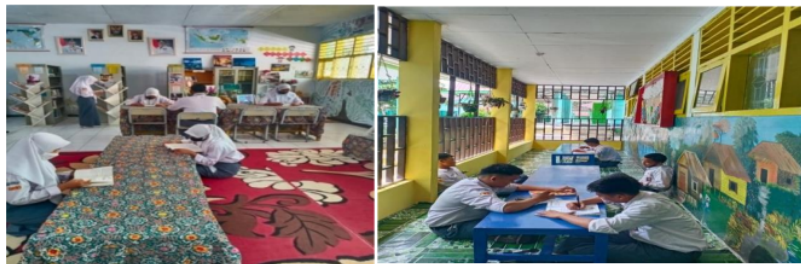
Gambar 1. Ruang Baca

Layanan baca di tempat adalah perpustakaan menyediakan tempat atau area khusus membaca koleksi siswa untuk menambah informasi dari bahan pustaka tersebut.