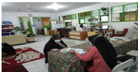
Gambar 9. Bimbingan Konseling siswa di perpustakaan Cahaya Ilmu

Layanan Konseling Pustaka adalah perpustakaan menyediakan bahan pustaka koleksi untuk menambah pengetahuan anggota perpustakaan dengan bantuan guru konseling untuk perbaikan nilai siswa.