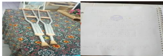
Gambar 8. Penunjang layanan disabilitas.

Layanan Disabilitas adalah perpustakaan menyediakan bahan pustaka koleksi Disabilitas untuk menambah pengetahuan anggota perpustakaan mengenai jenis koleksi khusus.