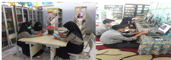
Gambar 6. Penggunaan akses internet

Layanan IT adalah kegiatan mencari dan menyediakan WIFI dan akses internet bagi pengguna perpustakaan.