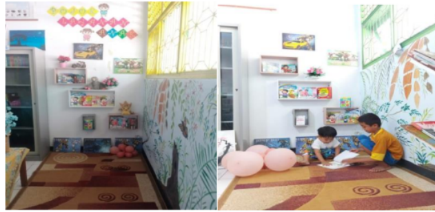
Gambar 4. Layanan Anak