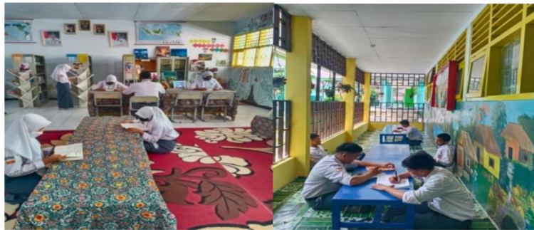
Gambar 1. Ruang Baca

Layanan baca di tempat adalah perpustakaan menyediakan tempat atau area khusus membaca koleksi siswa untuk menambah informasi dari bahan pustaka tersebut.