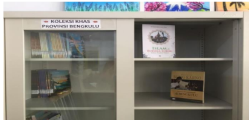
Gambar 7. Koleksi Kedaerahan yang disebut Bengkulu Siana

Layanan Konten Lokal adalah layanan perpustakaan yang menyediakan bahan pustaka koleksi Khusus Konten Lokal Provinsi Bengkulu dengan berbagai macam jenis seperti kebudayaan atau tradisi, sejarah, agama yang ada di Provinsi Bengkulu.