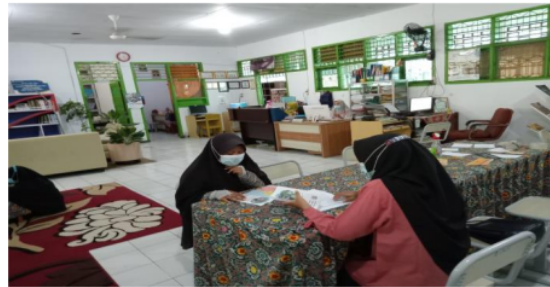
Gambar 9. Bimbingan Konseling siswa di perpustakaan Cahaya Ilmu

Layanan Konseling Pustaka adalah perpustakaan menyediakan bahan pustaka koleksi untuk menambah pengetahuan anggota perpustakaan dengan bantuan guru konseling untuk perbaikan nilai siswa.